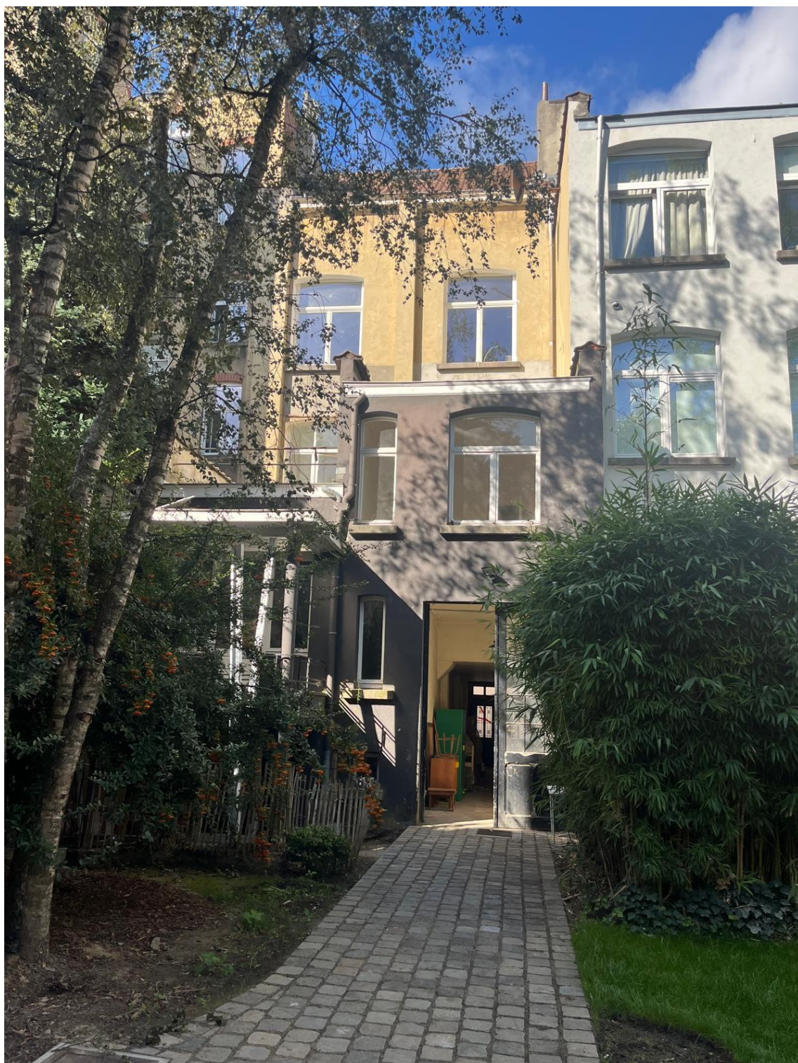
PHOTO 02 – Vue sur l'entrée cochère depuis la cour – septembre 2025