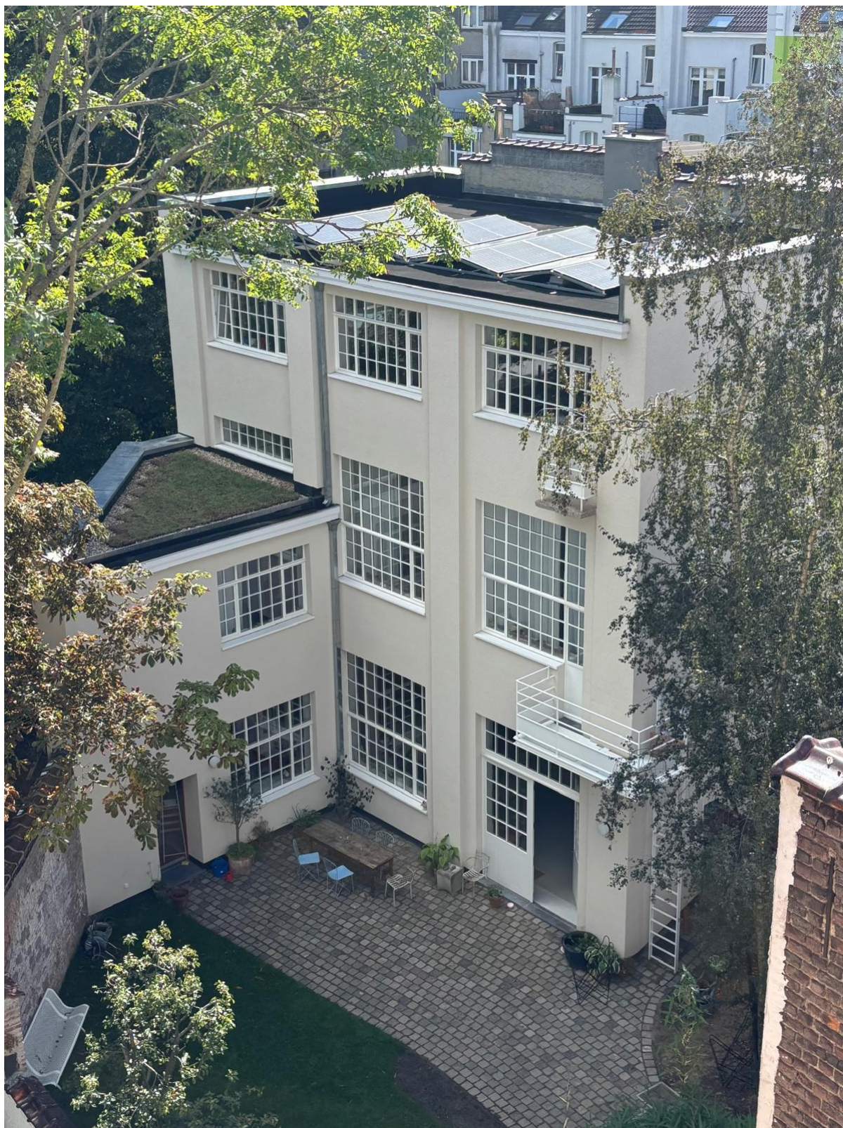
PHOTO 03 – Vue d'ensemble du bâtiment et de la cour – septembre 2025